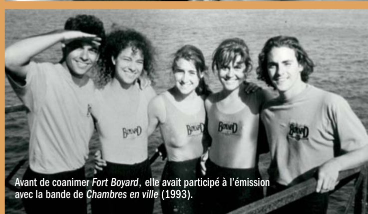
Avant de coanimer Fort Boyard , elle avait participé à l'émission avec la bande de Chambres en ville (1993).