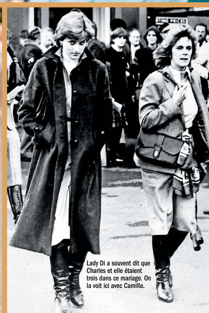
Lady Di a souvent dit que Charles et elle étaient trois dans ce mariage. On la voit ici avec Camilla.