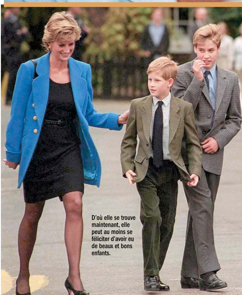
D'où elle se trouve maintenant, elle peut au moins se féliciter d'avoir eu de beaux et bons enfants.