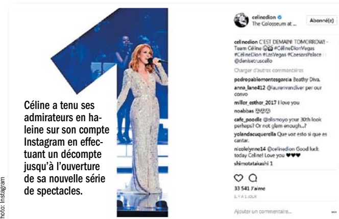
Céline a tenu ses admirateurs en haleine sur son compte Instagram en effectuant un décompte jusqu'à l'ouverture de sa nouvelle série de spectacles.